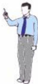
2. Désignation du combattant ( Tchong/Hong )