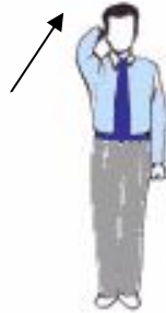
5. Arment du geste de mise en garde