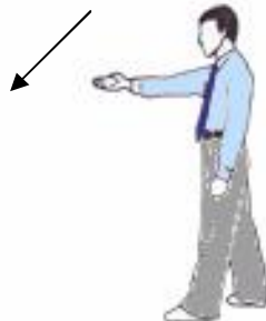
Geste de séparation : Kalyeo (vue de profil)