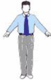
2. Appel des combattants : Tchong - Hong ( indication des emplacements )