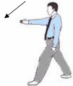
6. Position de combat : Joon-bi