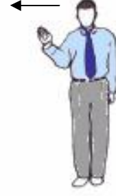
4. Fin du geste d'avertissement