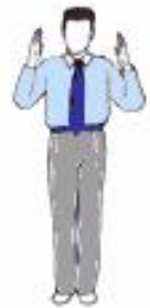
3. Préparation des saluts : Tchalvot