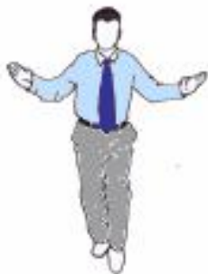
7. Arment du geste de début de combat