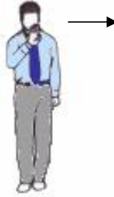
3. Geste de gauche à droite de la main